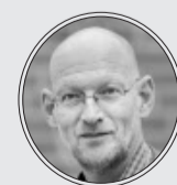
Von Wilfried Roggendorf

Ärgerlich ist ein Fehlalarm wie jetzt im Lookentor immer: sowohl für die Mitglieder der Freiwilligen Feuerwehr, die deswegen von ihren Arbeitsstellen weg hin zum Einsatzort eilen müssen, als auch für die Geschäftsleute dort, die wegen der Evakuierung Umsatzeinbußen zu beklagen haben. Aber diesem Fehlalarm ist auch etwas Positives abzugewinnen: Er hat gezeigt, dass die Notfallpläne funk-